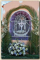
Cruz de Las Animas