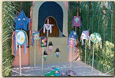
Cruz de Los Bolos