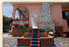
Cruz Camino Los Brezos