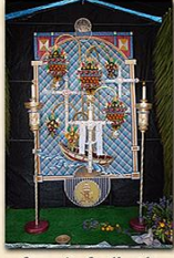
Cruz de La Pasión