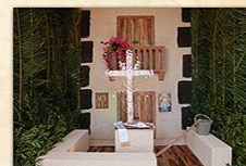
Cruz del Centro de Acogida