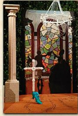
Cruz del Morro