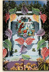
Cruz del Centro