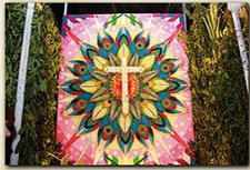
Cruz Lomo Llanito