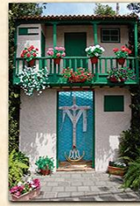
Cruz de La Sociedad