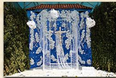
Cruz de La Piedad