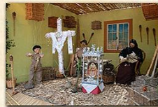
Cruz del Manchón