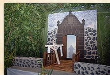
Cruz de El Llanito