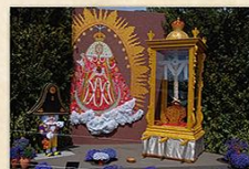
Cruz del Medio