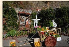
Cruz de La Caldereta