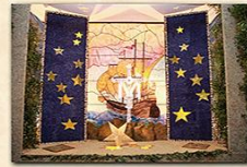
Cruz de La Laja del Barranco