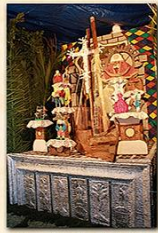
Cruz de La Calafata