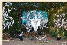
Cruz de La Glorieta