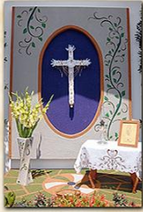
Cruz de Miranda