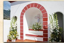
Cruz de Las Ledas