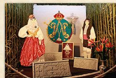
Cruz de Los Chicos