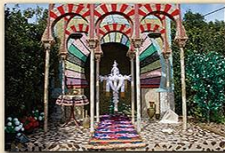
Cruz de La Pavona