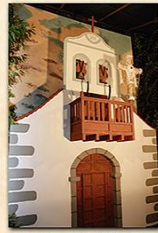
Cruz del Rosal