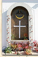
Cruz de Los Alamos